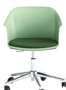
Base in acciaio cromato d.640 e ruote rigide d.50